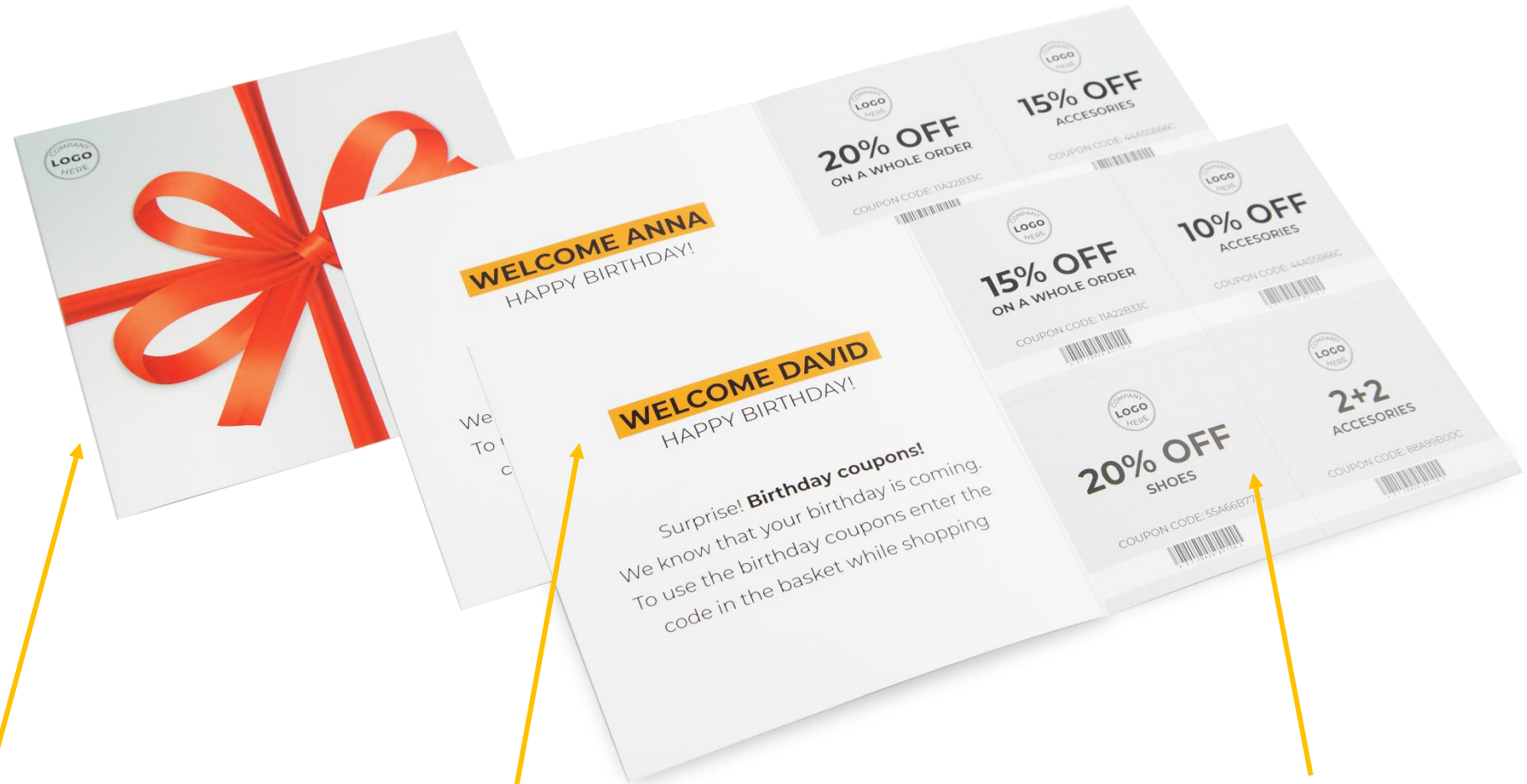
YOUR KEY VISUAL